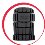
Ochraniacze kolan do spodni/ogrodniczek ochronnych

MATERIAL: 65% poliester, 35% bawełna, 270g/m 2 / 90% nylon, 10% elastan, 240g/m 2 . Wytrzymała tkanina typu CANVAS. Materiał stretch „4-way elastic” (rozciągliwość w 4 kierunkach) zapewnia wysoką elastyczność i wygodę podczas użytkowania. 13 kieszeni, w tym 2 zamykane na suwak. Kieszeń na identyfikator. Kieszeń na telefon komórkowy. Nogawki z wentylacją z siatki, zamykaną na suwak. Wstawki odblaskowe zwiększające bezpieczeństwo podczas pracy. Potrójne szwy. Wysokiej jakości zamek błyskawiczny YKK. Szwy w kroku wzmocnione od wewnątrz dodatkową wstawką. Innowacyjna regulacja szerokości w pasie za pomocą specjalnej konstrukcji z elastyczną taśmą. Możliwość wydłużenia nogawek (+2,5 cm). Antypoślizgowa taśma w pasie (po wewnętrznej stronie) zapobiegająca wysuwaniu się górnej części garderoby ze spodni. Oczko na klucze. 2 uchwyty na akcesoria. Szlufki na pasek. Wzmocnione kieszenie, kieszenie na ochraniacze kolan oraz dół spodni materiałem Cordura® (420D nylon) o wysokiej odporności na przetarcia. Krój „slim fit”. Modny i ciekawy design. Wszywka identyfikacyjna.