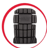
Ochraniacze kolan do spodni/ogrodniczek ochronnych