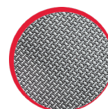
Wzmocnienia materiałem odpornym na przetarcia