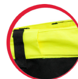
Innowacyjna regulacja szerokości w pasie